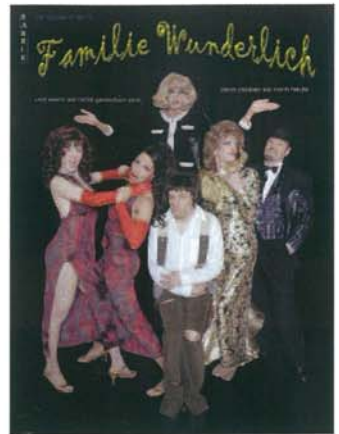
Die „Familie Wunderlich“ kommt mit ihrem Showcocktail.