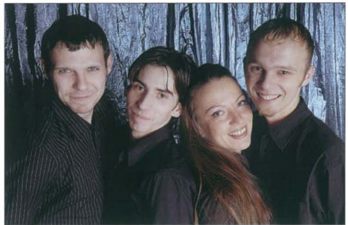
Das Team der Kleinkunstbar.

seien meine Mitarbeiter genannt, die stets für unsere Gäste da waren und auch in Zukunft da sein werden. Als gastronomischer Ausbildungsbetrieb haben wir in